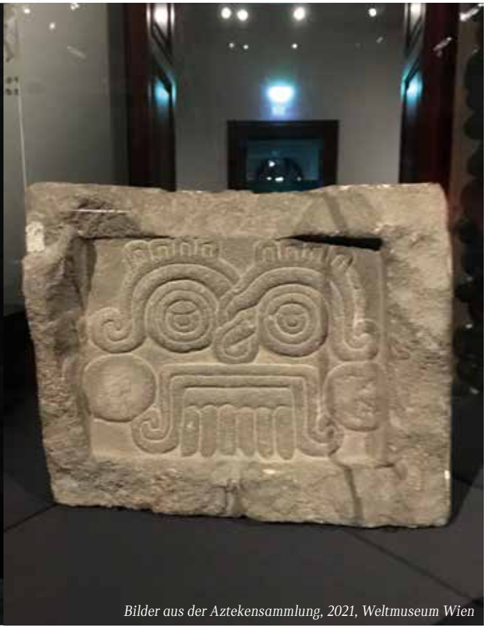
Bilder aus der Aztekensammlung, 2021, Weltmuseum Wien

dazu, Erfahrung zu neutralisieren, zu löschen und zu eliminieren. Und im digitalen Jetzt – in unserer Zeit – geschieht beides zugleich. Krieg findet statt. Und ist trotzdem nur noch Frame, Kommentar, Hashtag, «Eilmeldung – jetzt liken!». So verwandeln sich im Roman bei DeLillo alle Storys in ein Bilderrauschen. Deshalb lese ich diese zwei Werke zusammen, eines nur auf Englisch, das andere auf Deutsch übersetzt. Denn nur zusammen ergeben sie die eigentliche Diagnose unserer Epoche: die Vernichtung und Simulation durch die algorithmische Welt. Deshalb nenne ich die Neuauflage meines Bestsellers von 2018 auch «Trumpism. The Algorithmic Age» – weil in dieser englischen Version die ungeheure Macht der Codes philosophisch und politisch weitergedacht wird, bis hin zur Annihilation.