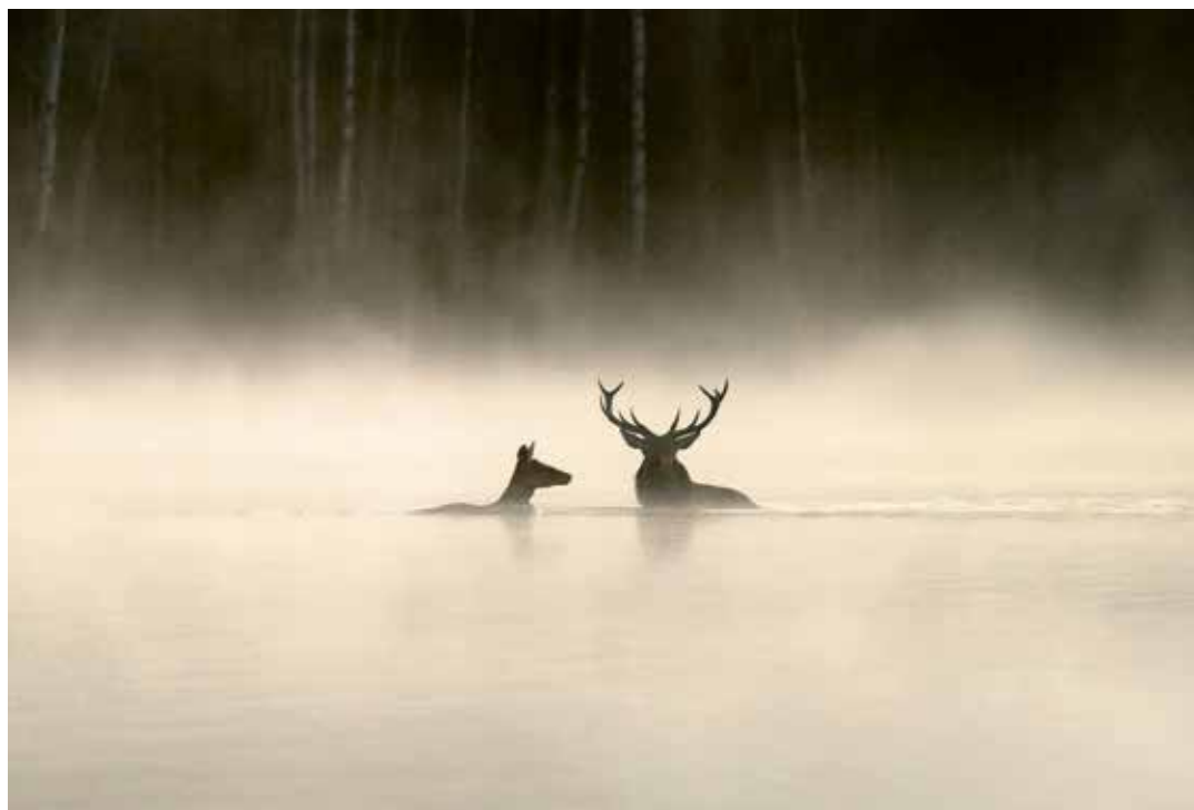
Schule des Sehens: Szene aus «Le chant des forêts».

Auf den König der hiesigen Wälder, den geheimnisvollen Auerhahn, der sich wie ein roter Faden durch den Film zieht, wartet das Trio vergeblich. Er ist aus den Vogesen verschwunden. Um dem Enkel ein lebendes Exemplar in freier Wildbahn zu zeigen, reisen sie nach Norwegen. Hier greift Vincent Munier dann doch zu ein paar typischen Tierfilm-Manipulationen, die seinem Werk sofort die fluide Zauberkraft nehmen. Aber sein Film bleibt eine meditative, grosse Liebeserklärung an die Natur.