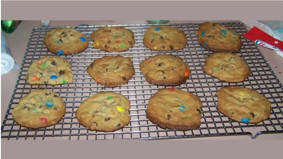
Der vorne rechts, ist der, der Ihnen vom Flüchtling geklaut werden könnte... die anderen sind eh dem Banker.

publiziert: Mittwoch, 15. Jul 2015 / 09:27 Uhr / aktualisiert: Donnerstag, 16. Jul 2015 / 10:15 Uhr