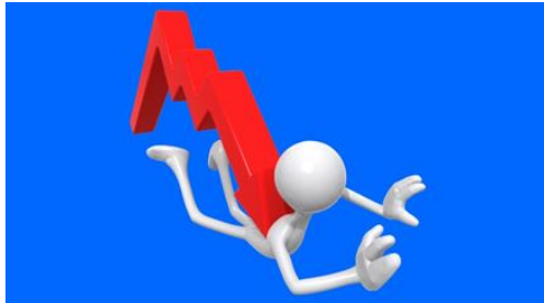
Wahlbörse erschlägt Wähler. Illustration: Scott Maxwell (Lizenz: CC BY)