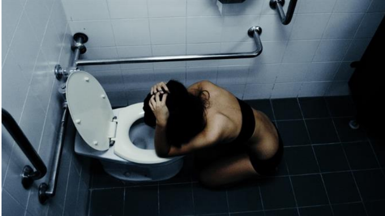
Bulimie: Das «tägliche Brot» als perfekter Handlungsort zur Bestrafung des eigenen Körpers und damit des eigenen Ausdrucks, des eigenen Seins.

publiziert: Mittwoch, 8. Apr 2015 / 14:31 Uhr / aktualisiert: Mittwoch, 8. Apr 2015 / 14:56 Uhr