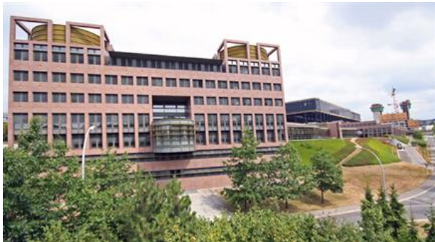
EuGH in Luxemburg: Juristisch abgesicherte ...