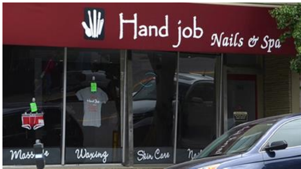
Hand job Nails & Spa, The Castro, San ... Foto: Adam Fagen (Lizenz: CC BY-NC-SA-3.0)