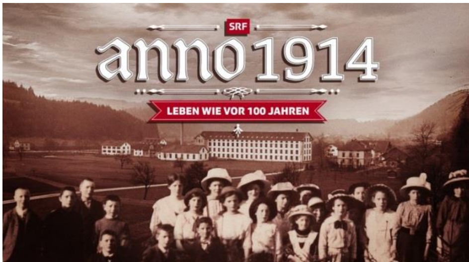
Öffentliche Gelder für opportunistische Dokuform SRF's «Anno 1914»

publiziert: Mittwoch, 26. Feb 2014 / 08:49 Uhr / aktualisiert: Mittwoch, 26. Feb 2014 / 09:20 Uhr