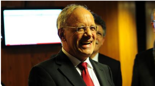
Kämpfer wider Handelsschranken und ...