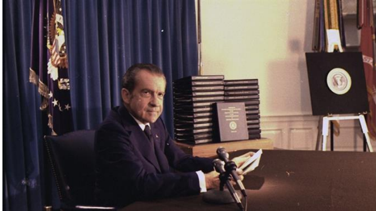
Aus einer Zeit, als Präsidenten noch nicht über dem Recht standen: Richard Nixon gibt die Transkriptionen der Bänder frei, die zu seinem Sturz führen werden.

publiziert: Mittwoch, 18. Dez 2013 / 10:04 Uhr / aktualisiert: Mittwoch, 18. Dez 2013 / 11:10 Uhr