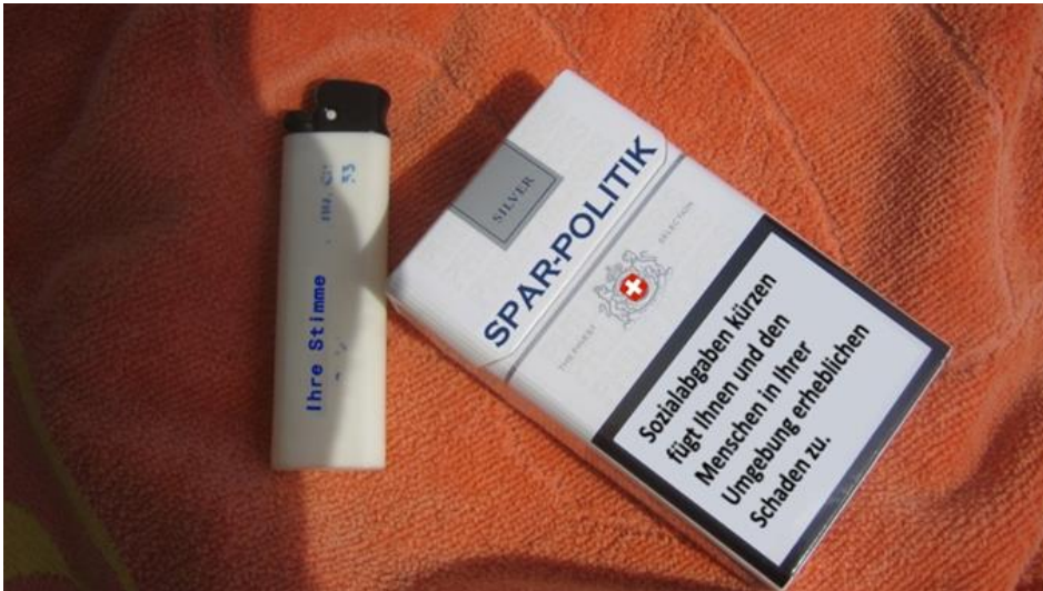
Zeit, auch Politik(er) mit Warnhinweisen zu versehen.

publiziert: Mittwoch, 2. Mrz 2016 / 08:53 Uhr / aktualisiert: Montag, 7. Mrz 2016 / 10:13 Uhr