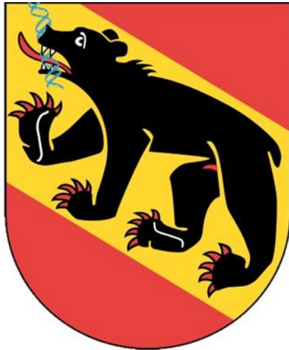
Berner Bär mag DNA: Nach dem Bundesgerichtsüfftel Ende 2014 gelobte Foto: Patrik Etschmayer (DNA: Greg Emmerich CC BY SA 3.0) (news.ch) die Berner Kantonspolizei Besserung. Daraus wurde leider nichts. Höchste Zeit für einen Lemprozess.

publiziert: Mittwoch, 6. Jan 2016 / 11:35 Uhr / aktualisiert: Mittwoch, 6. Jan 2016 / 14:00 Uhr