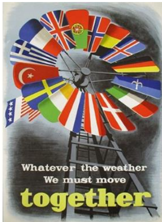
«Demokratie lässt sich auch befehlen» - Die Demokratisierung Deutschlands nach dem Krieg - auch durch den Marshallplan - ist Beweis dafür.

publiziert: Mittwoch, 27. Jan 2016 / 11:56 Uhr / aktualisiert: Mittwoch, 27. Jan 2016 / 14:22 Uhr