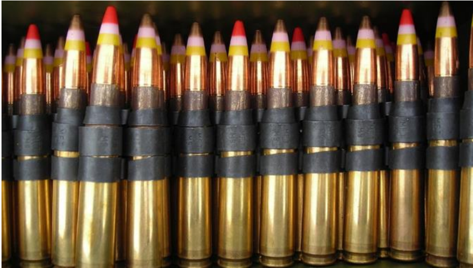
Differenziert über Waffenexporte nach Saudi Arabien entscheiden: Leuchtsmunition (Beispielbild)

publiziert: Mittwoch, 24. Feb 2016 / 13:35 Uhr / aktualisiert: Mittwoch, 24. Feb 2016 / 14:05 Uhr