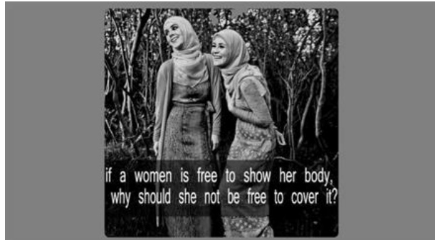
Der Frauenkörper als Verhandlungsort von ...