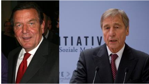
Als Sozialdemokraten gewählt, als ...