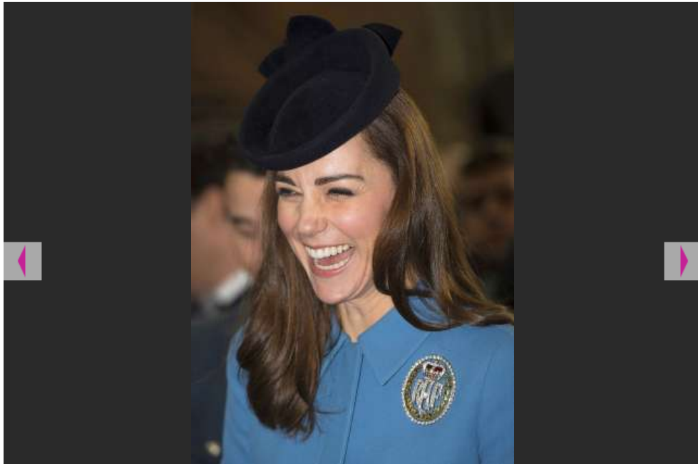
London - Was für ein herzhaftes, ansteckendes Lachen! Herzogin Kate (34) ist seit dem letzten Dezember «Luftwaffenkommandantin ehrenhalber» (als Nachfolgerin des 94-jährigen Prinz f