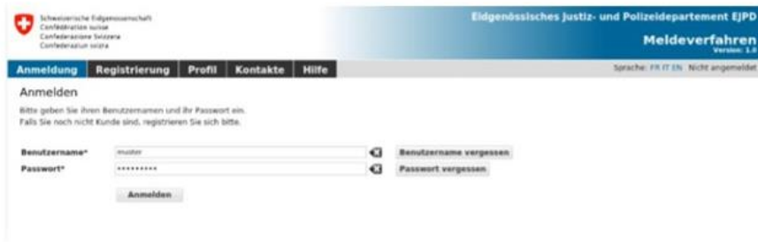
Mehr Vertrauen in den Staat dank «CD Bund» - oder das Gegenteil?

Der einheitliche visuelle Auftritt soll die gemeinsame Identität der Bundesverwaltung stärken, das Vertrauen in den Staat fördern sowie zur Glaubwürdigkeit und Sicherheit öffentlicher Dienstleistungen beitragen.