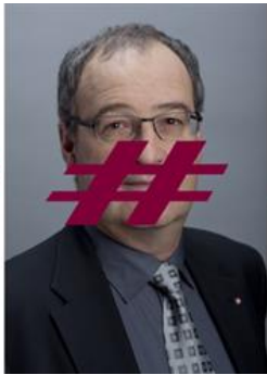
Gewählt ist #Parmelin, #irgendein Weinbauer, ...