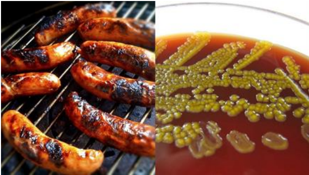
Was ist wohl gefährlicher: Die Grillwurst ... Foto: mostly*harmless (Bakterien) H Michael K.