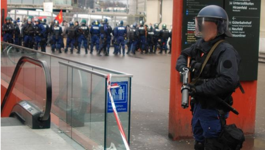
Polizist mit Tränengas im Anschlag: Wenn in der Schweiz, für den «Service Public» kein Thema.

publiziert: Mittwoch, 16. Sep 2015 / 09:06 Uhr / aktualisiert: Mittwoch, 16. Sep 2015 / 13:17 Uhr