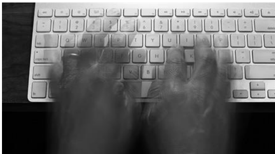
Auch negative Aufmerksamkeit ist ...