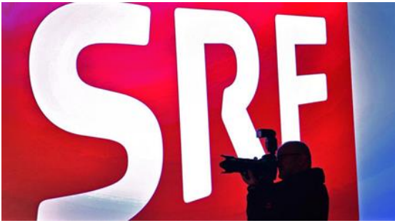
SRF: Definiert Wahlthemen und wo links und rechts ist und sagt dem...