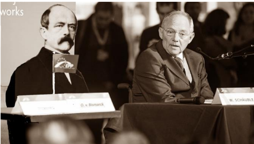
Harmonisch vereint auf einem Bild: «Deutscher Autoritätsriss: Von Bismarck bis Schäuble» Montage: Patrik Etschmayer (news.ch)

publiziert: Mittwoch, 12. Aug 2015 / 10:48 Uhr / aktualisiert: Mittwoch, 12. Aug 2015 / 11:09 Uhr