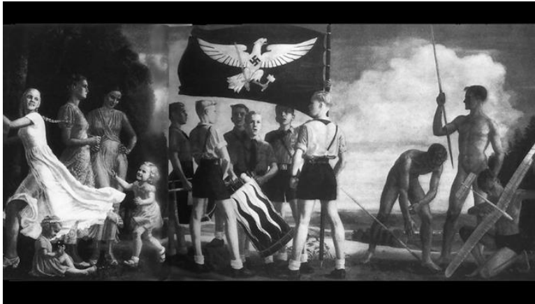
Noch ein mittelalterliches Geschlechterbild - dieses knappe 80 Jahre alt... und doch dem derzeitigen Zeitgeist so mancher entsprechend.

publiziert: Mittwoch, 4. Feb 2015 / 15:19 Uhr / aktualisiert: Mittwoch, 4. Feb 2015 / 16:10 Uhr