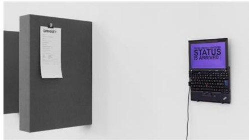
Der böse Bot bei der Arbeit: Ausstellung der ...