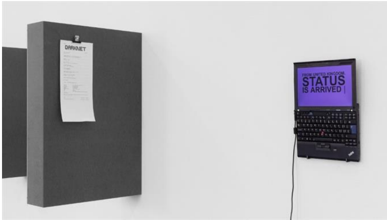
Der böse Bot bei der Arbeit: Ausstellung der !Mediengruppe Bitnik

publiziert: Mittwoch, 28. Jan 2015 / 11:54 Uhr / aktualisiert: Mittwoch, 28. Jan 2015 / 12:23 Uhr