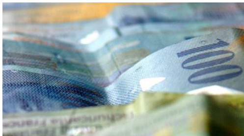
Luxusgut Schweizer Franken: Das Geld für die Reichen!