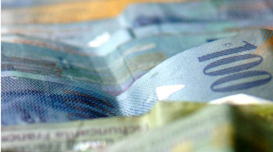
Luxusgut Schweizer Franken: Das Geld für die Reichen!

publiziert: Mittwoch, 21. Jan 2015 / 13:40 Uhr / aktualisiert: Mittwoch, 21. Jan 2015 / 14:02 Uhr