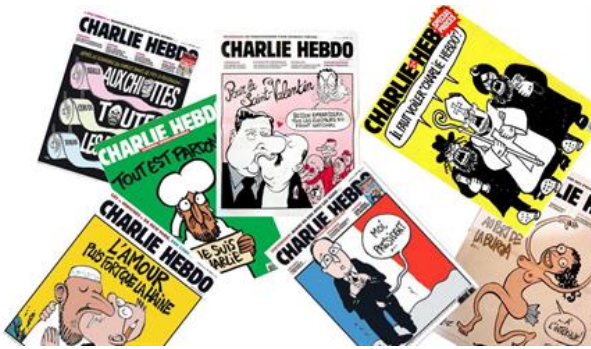
Auklärung erforderte zu Bildem Bilanz: ...