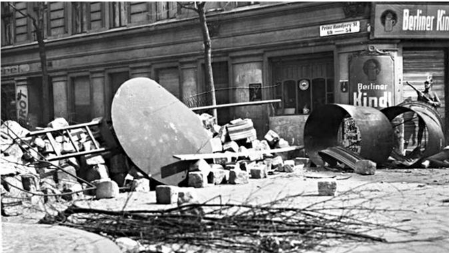
Barrikaden in Berlin, Mai 1929: Vom Crash zur Katastrophe war es kein Foto: Bundesarchiv, B 145 Bild-P046278 / Weinoth, Carl / CC-BY-SA (Langer Weg).

publiziert: Mittwoch, 17. Dez 2014 / 10:00 Uhr