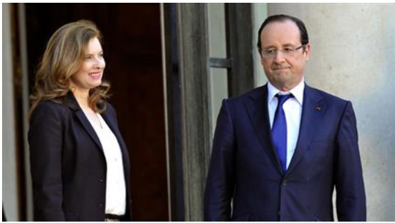
Valérie Trierweiler und ihr damaliger Partner François Hollande; Darrels,...