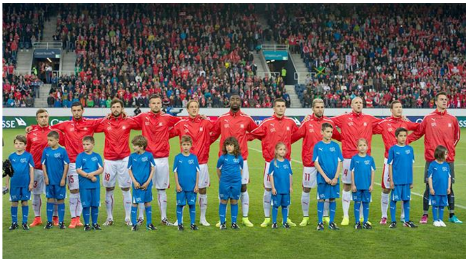
Nationalmannschaft beim Brummen unserer kryptischen Hymne

publiziert: Mittwoch, 9. Jul 2014 / 10:59 Uhr / aktualisiert: Mittwoch, 9. Jul 2014 / 11:40 Uhr