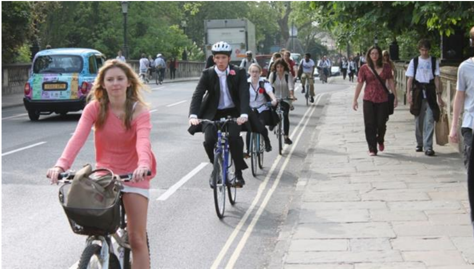
Fahradhelme als kurioser Gradmesser der Freiheitsrechte: Strassenszene in Oxford.

publiziert: Mittwoch, 25. Jun 2014 / 10:54 Uhr / aktualisiert: Mittwoch, 25. Jun 2014 / 11:19 Uhr