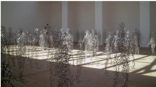
Antony Gormley, Installation «Domain ...