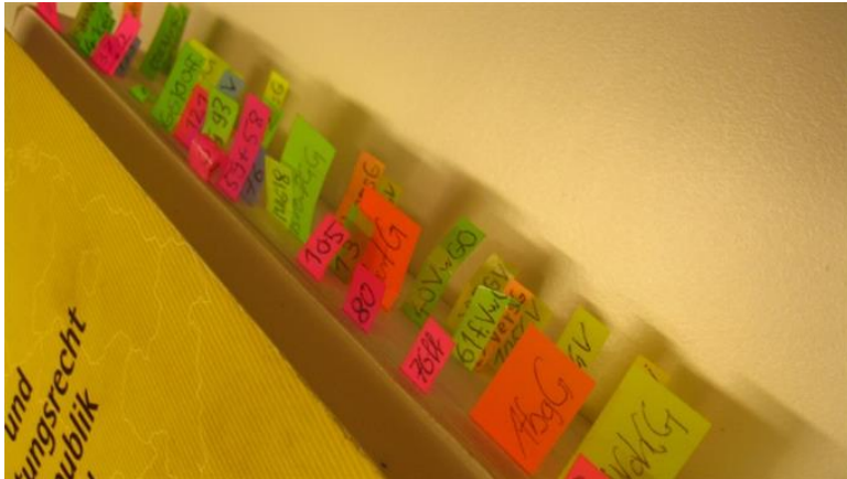
Deutsche Gesetze: Manch Nazi-Gesetz ist immer noch in Kraft.

publiziert: Mittwoch, 6. Nov 2013 / 09:19 Uhr / aktualisiert: Mittwoch, 6. Nov 2013 / 13:13 Uhr