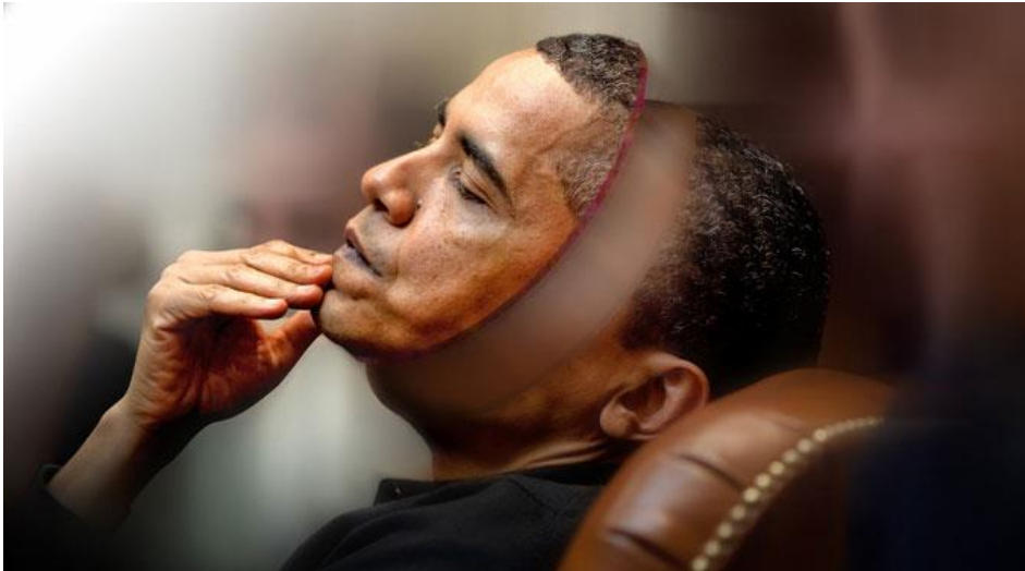
Barack Obama entpuppte sich als die berechnenste Wallstreet-Nutze, die Washington je gesehen hat.

publiziert: Montag, 7. Okt 2013 / 11:24 Uhr / aktualisiert: Montag, 7. Okt 2013 / 12:38 Uhr