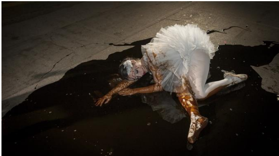
Schwan, im Öl gestorben: Greenpeace-Protest gegen Gazprom vor der Tonhalle

publiziert: Montag, 21. Okt 2013 / 10:17 Uhr