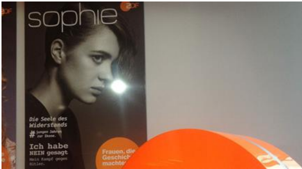
Die wunderbare Widerstandskämpferin Sophie Scholl als ...