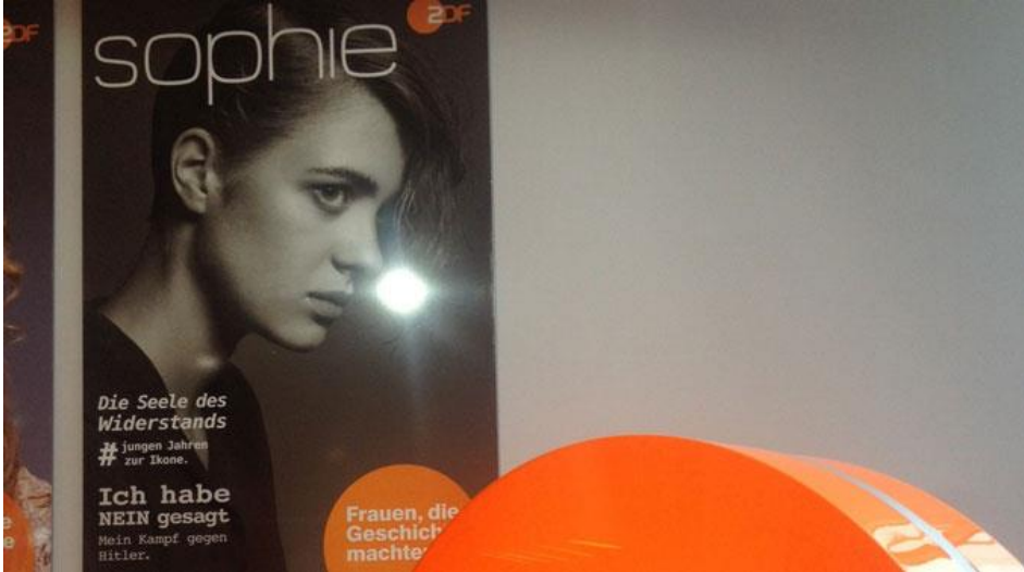
Die wunderbare Widerstandskämpferin Sophie Scholl als Cosmopolitan-PinUp Girl vomöffentlich-rechtlichen Rundfunk verhunzt.

publiziert: Mittwoch, 16. Okt 2013 / 11:28 Uhr / aktualisiert: Mittwoch, 16. Okt 2013 / 14:49 Uhr