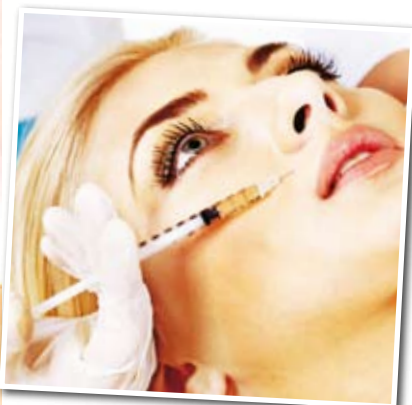
Erste kleine Falten werden sofort weggespritzt – schließlich ist Altern gerade out

Statistik: „Finden Sie sich selbst schön?“