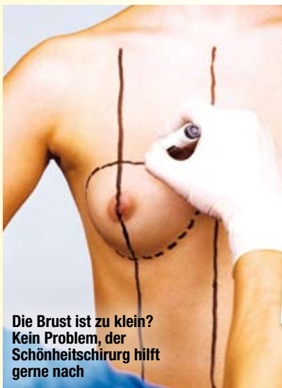
Die Brust ist zu klein? Kein Problem, der Schönheitschirurg hilft gerne nach